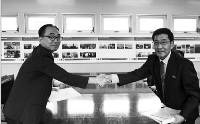
사진은 대한적십자사와 북측 조선적십자회 실무진들이 이산가족 상봉행사 최종 대상자 명단을 교환하는 모습.

▲ 대한적십자사는 지난 4일 오후 판문점에서 8·15 계기 이산가족 상봉 대상자 최종명단(남 93명, 북 88명)을 교환했다고 밝혔다. 최종명단에 포함된 남측 방문단 93명은 오는 20일부터 22일까지 재북가족을, 북측 방문단 88명은 24일부터 26일까지 재남가족을 금강산에서 상봉하게 된다.