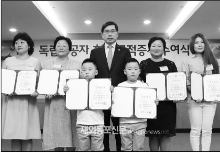
▲ 박상기 법무부 장관이 13일 오전 정부과천청사 법무부 대회의실에서 열린 독립 유공자 후손 국적증서 수여식에서 증서 수여 후 함께 기념촬영을 하고 있다.