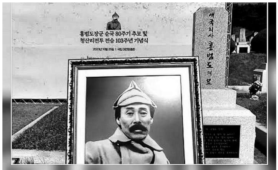
고려인 역사 탐방